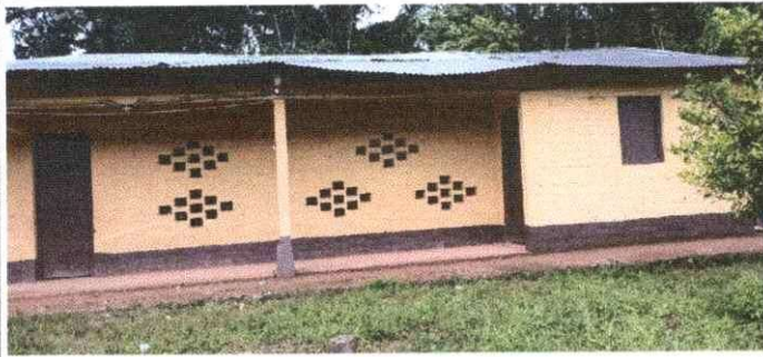
Foto 1: Las láminas que cubren la escuela están oxidadas, presentan agujeros y hundimiento lo que agrava el deterioro general de la infraestructura.