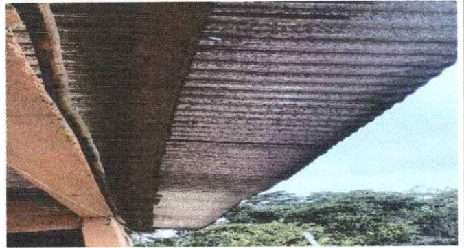
Foto 2: Se puede observar que las vigas de madera están deterioradas, por la filtración de agua de las laminas y presentan signos avanzados de polilla.