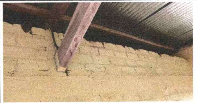
Foto 6: Las paredes se encuentran agrietadas y deterioradas por lo que necesitan repello.

Observación: Si es necesario se pueden agregar hojas adicionales y actualizar el número de hojas.