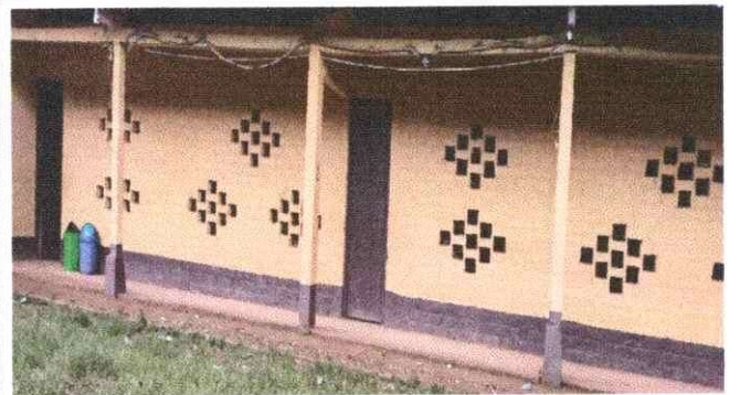
Foto 4: El cableado eléctrico no funciona hace varios años, por lo que esta a oscuras totalmente.